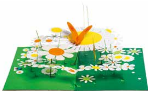
Le jardin des papillons © UG

Des décors pop-up de UG voyageront dans les bibliothèques tout au long de la grande exposition. L'occasion de croiser quelques oiseaux colorés, des papillons et des lutins des bois.